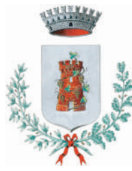
Comune di CERNUSCO LOMBARDONE