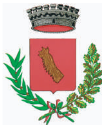
Comune di OSNAGO