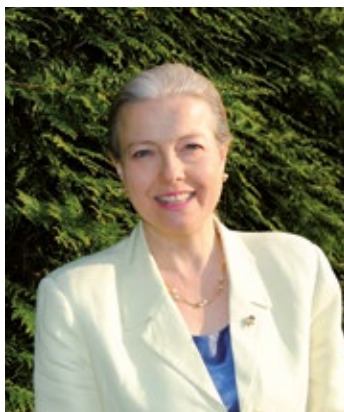
Giovanna De Capitani Sindaco di Cernusco Lombardone